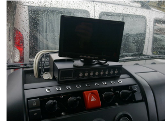
Görüş Sistemi / Vision System