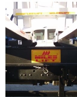
Kamera / Camera